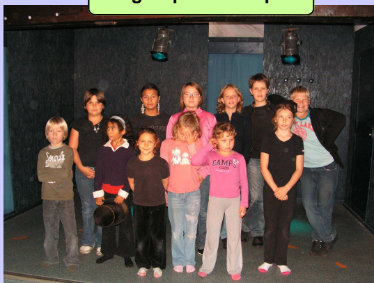
Le groupe au complet